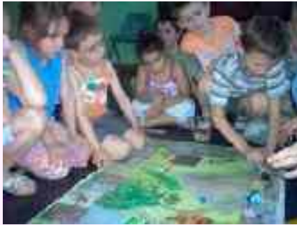
Tra i bambini del circolo