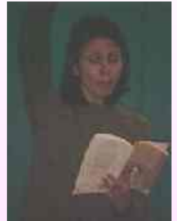
L'attrice teatrale Paola Rossi