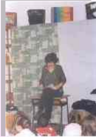
La scrittrice Silvia Roncaglia