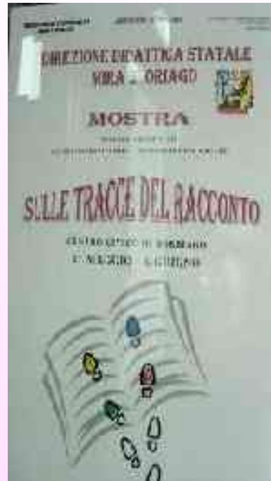
Nel territorio - Mostra